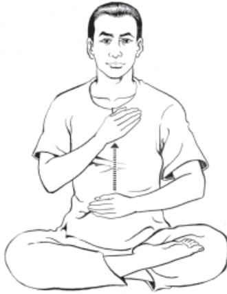
๘. เลื่อนมือขวาขึ้นหน้าอก...ให้รู้สึก