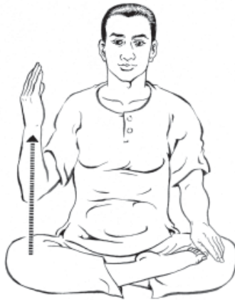
๓. ยกมือขวาขึ้นครึ่งตัว...ให้รู้สึก... มันหยุดก็ให้รู้สึก