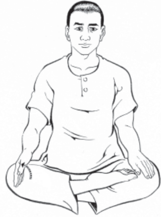
๒. พลิกมือขวาตะแคงขึ้น...ทำซ้ายๆ...ให้รู้สึก