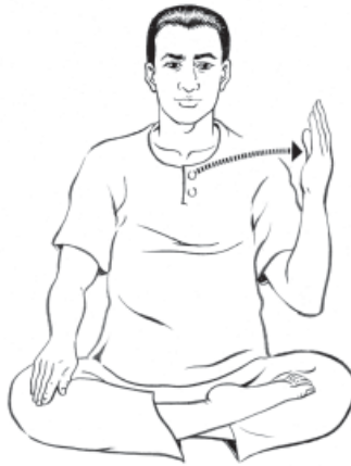
๑๓. เอมือซ้ายออกมาตรงข้าง... ให้มีความรู้สึก