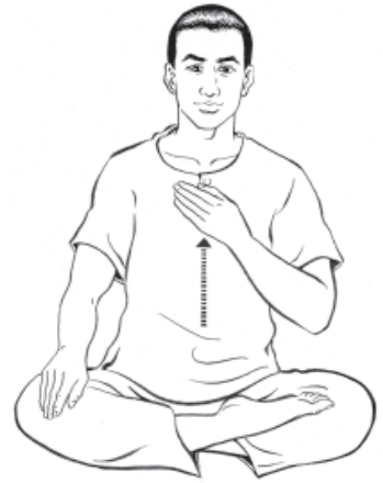
๑๒. เลื่อนมือซ้ายขึ้นที่หน้าอก... ให้มีความรู้สึก