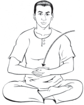
๗. เอามือซ้ายมาที่สะดือ...ให้รู้สึก