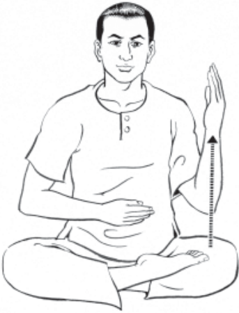
๖. ยกมือซ้ายขึ้นครึ่งตัว...ให้มีความรู้สึก