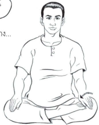
๑๕. คว่ำมือซ้ายลงที่ขาซ้าย...ให้รู้สึก ทำต่อไปเรื่อยๆ...ให้รู้สึก