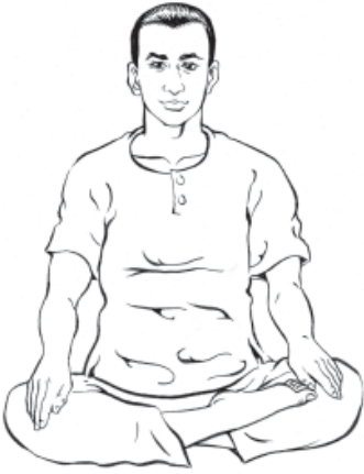
๑. เอามือวางไว้ที่ขาทั้งสองข้าง...คว่ำไว้