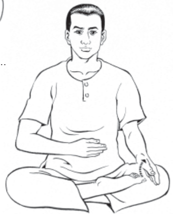
๕. พลิกมือซ้ายตะแคงขึ้น...ให้รู้สึก