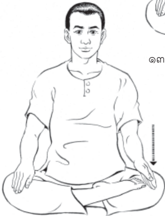
๑๔. ลดมือซ้ายลงที่ขาซ้าย ตะแคงไว้... ให้มีความรู้สึก