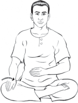
๑๑. คว่ำมือขวาลงที่ขาขวา...ให้รู้สึก