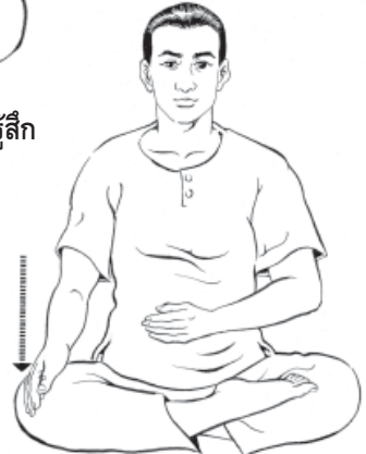
๑๐. ลดมือขวาลงที่ขาขวา ตะแคงไว้...ให้รู้สึก