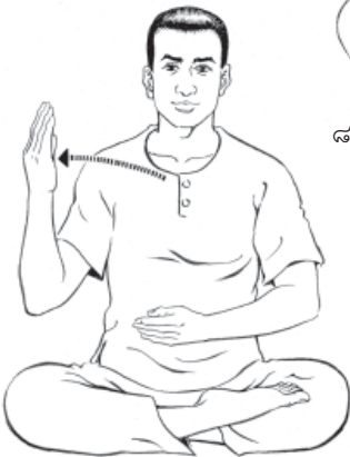
๙. เอามือขวาออกตรงข้าง...ให้รู้สึก